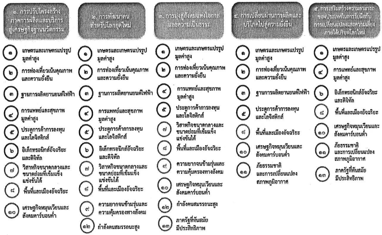
แผนภาพที่ ๓.๑ ความเชื่อมโยงระหว่างหมวดหมู่การพัฒนาทั้งเป้าหมายหลัก

ความเชื่อมโยงระหว่างหมวดหมู่การพัฒนาทั้งเป้าหมายหลักแสดงไว้ในแผนภาพที่ ๓.๑ โดยหมวดหมู่การพัฒนาที่กำหนดขึ้นเป็นประเด็นที่มีลักษณะเชิงบูรณาการที่ครอบคลุมการพัฒนาดังแต่ในระดับต้นน้ำจนถึงปลายน้ำ และสามารถนำไปสู่ผลพัฒนาทั้งในมิติเศรษฐกิจ สังคม ทรัพยากรธรรมชาติและสิ่งแวดล้อมไปพร้อมๆ กัน ทำให้หมวดหมู่แต่ละประการสามารถสนับสนุนเป้าหมายหลักได้มากกว่าหนึ่งข้อ นอกจากนี้การพัฒนาภายใต้แต่ละหมวดหมู่ไม่ได้แยกขาดจากกัน แต่มีการสนับสนุนหรือเอื้อประโยชน์ซึ่งกันและกัน